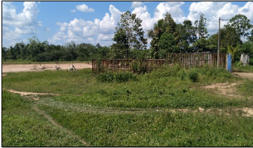
FOTOGRAFIA N°01: EROSION DE LA RIBERA DEL RIO QUE AFECTA A CARRETERA