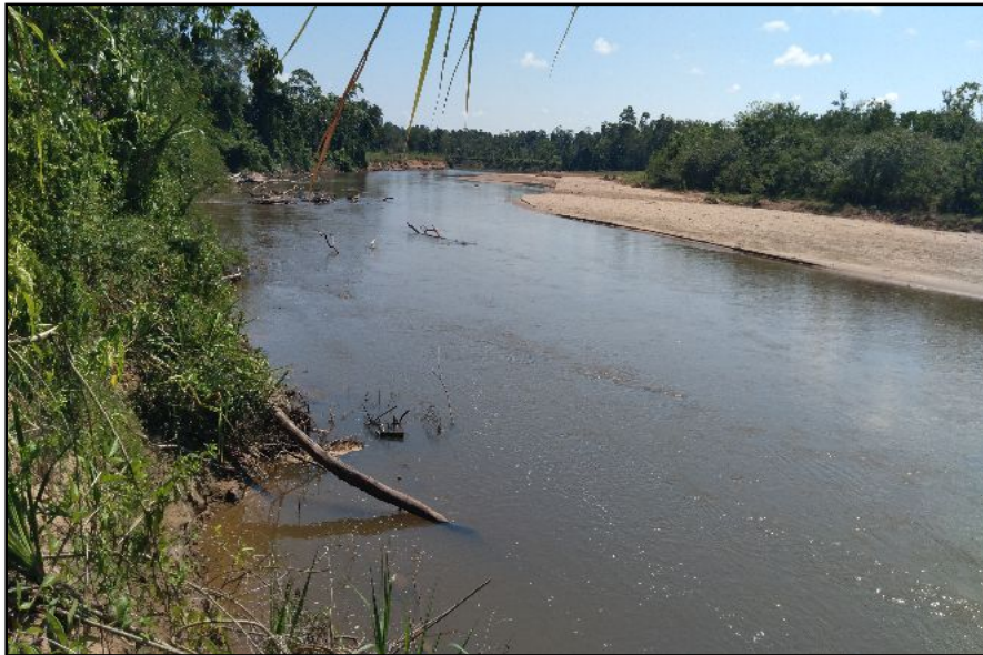
FOTOGRAFIA N°02: SE VISUALIZA LA COLMATACION DEL RIO Y LA EROSIÓN DE LA RIBERA.